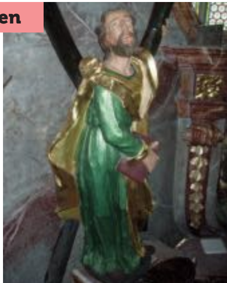
Unser Pfarrpatron Heiliger Andreas Apostel, Bruder des Simon Petrus

Die Gottesdienstordnung für alle Sonntage und Feiertage finden Sie auf Seite 13.