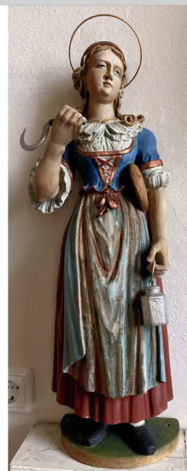
Pfarrkirche Münichreith (um 1900)

Die heilige Notburga gilt als Beispiel aufopfernder Pflichttreue, tätiger Nächstenliebe und tiefer Frömmigkeit. Sie ist die Patronin der Dienstmägde, Bauern, Armen, bei Viehkrankheiten und allen Nöten der Landwirtschaft sowie des Feierabends.